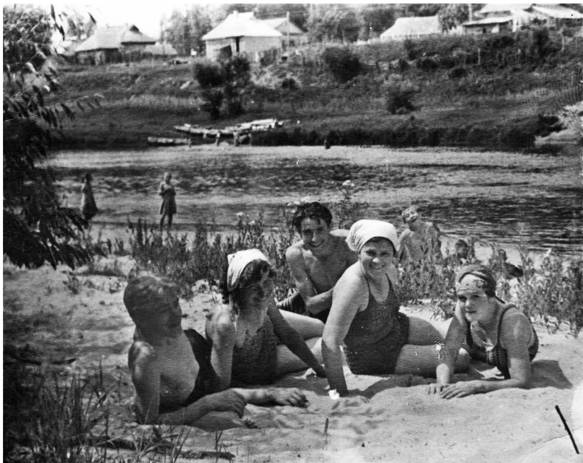
Отдыхаем! Творческая компания на берегу реки Жиздра.